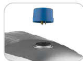
Miejsce na akcesoria dodatkowe .