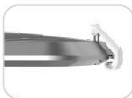
Beznarzędziowy dostęp poprzez uchwyt.