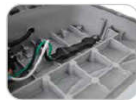
Zabezpieczenie przed rzezięciami 10kV.