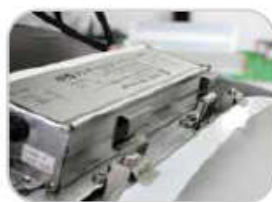
System szybkiej wymiany komponentów.