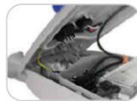
Auto rozłączanie zasilanie po otwarciu.