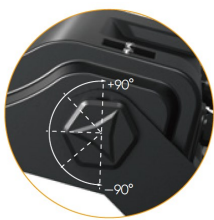
Łatwa regulacja Regulowany wspornik i pokrętło umożliwiają regulację w zakresie ±90°.