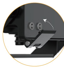
Minimalna konserwacja Konstrukcja uchwytu ułatwia wymianę soczewek i zasilacza