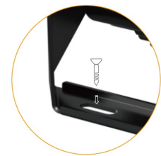
Łatwa i szybka instalacja Specjalnie profilowany wspornik zwiększa możliwości montażowe