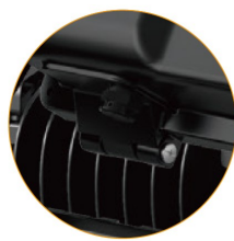
Układ wentylacji Zapobiega wewnętrznemu zaparowaniu i szronieniu oprawy